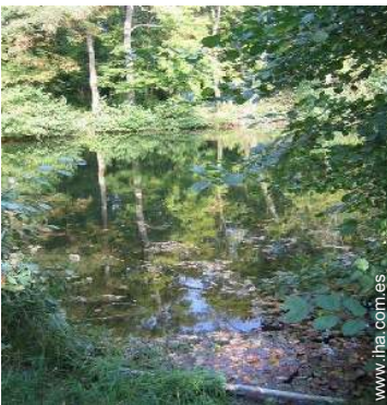
vista sobre el río