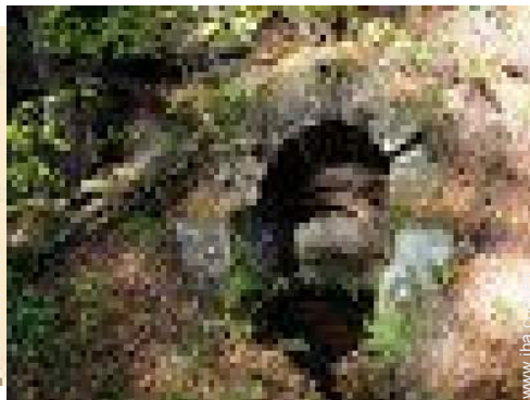
actividades de ocio de verano cercanas