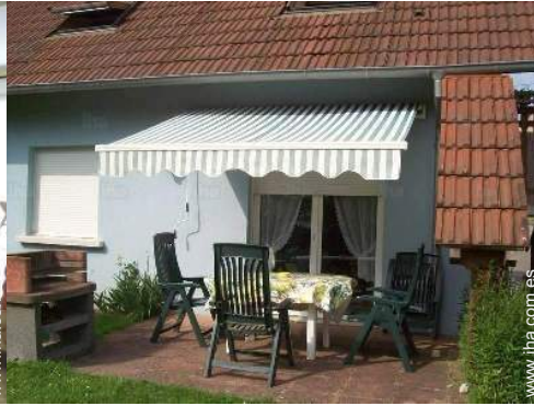
mesa(s) de jardín