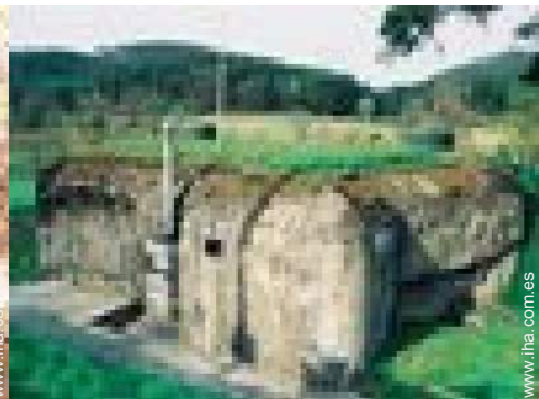
Presencia en el lugar