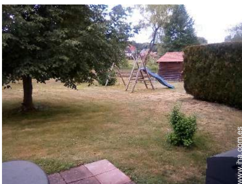
Marco exterior a disposición de los huéspedes