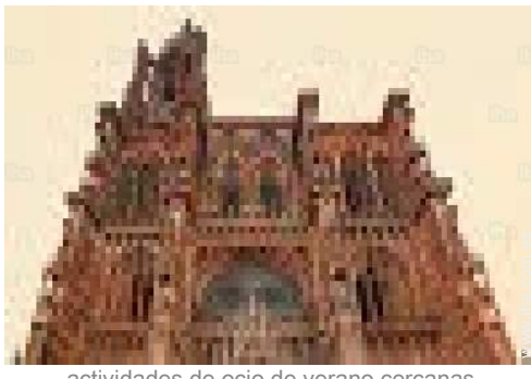
actividades de ocio de verano cercanas