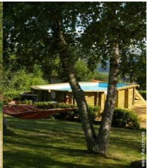
Marco exterior a disposición de los huéspedes