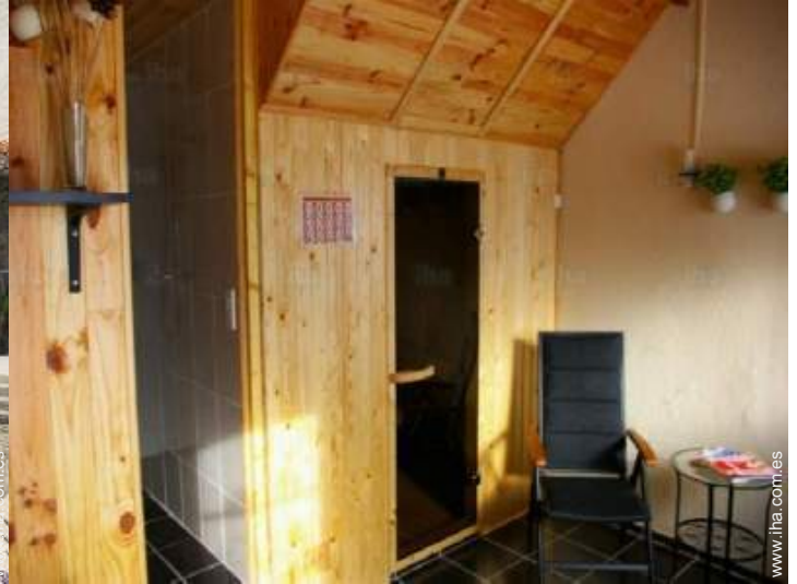
Instalaciones exteriores a disposición de los huéspedes