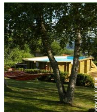
Marco exterior a disposición de los huéspedes

Centro del pueblo 5km El centro 25km Alquiler de bici/MTB 7,5km Alquiler de moto/escúter 25km Alquiler de coche 20km Alquiler de equipo de esquí 25km Alquiler de colada/lavandería <50m Panadería 5km Pequeños comercios 5km Supermercado 7,5km Comercios de lujo y de marcas 25km Peluquería 5km Cibercafé 25km Correos 7,5km Banco 7,5km Cajero automático 7,5km Farmacia 7,5km Médico 7,5km Enfermera 7,5km Hospital 25km