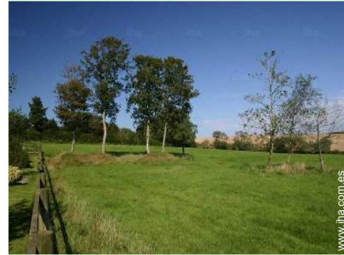
vista sobre pradera

Barbacoa, mesa(s) de jardín, columpio, columpio