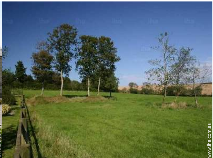
vista sobre pradera