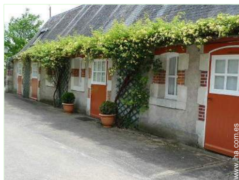
Casa de Piedra con Encanto

Silla de bebé, bañera bebé, orinal bebé, parque infantil