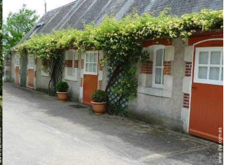
Casa de Piedra con Encanto