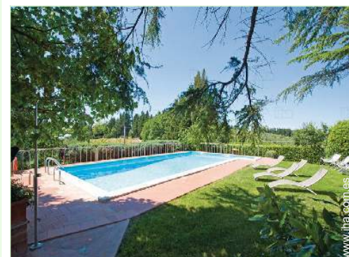
vista sobre la piscina