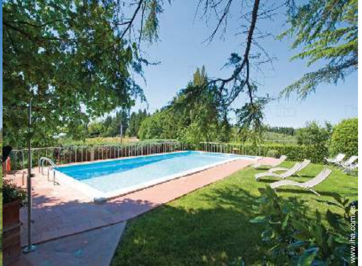
vista sobre la piscina