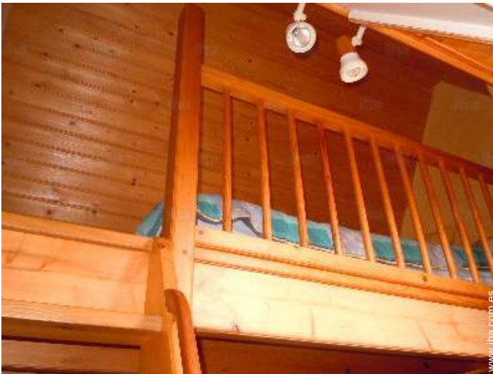
posibilidad cama(s) suplementaria(s)