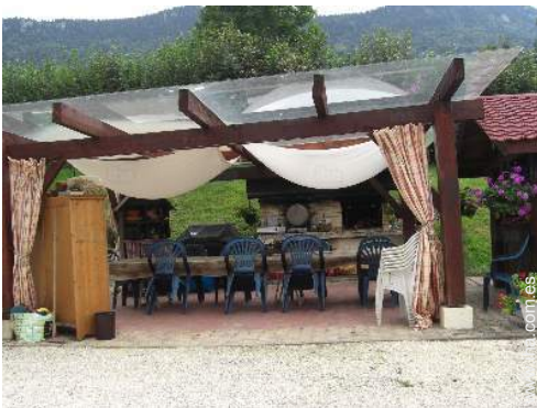
vista desde le piso