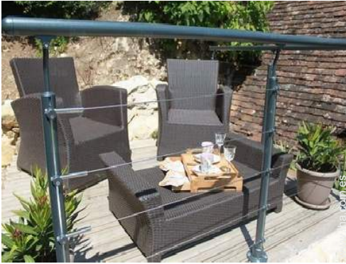
área de jardín