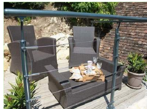
área de jardín