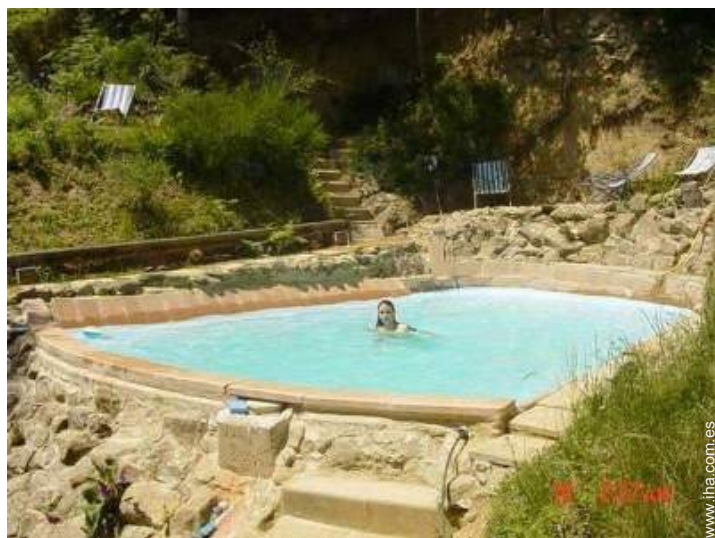
vista sobre la piscina