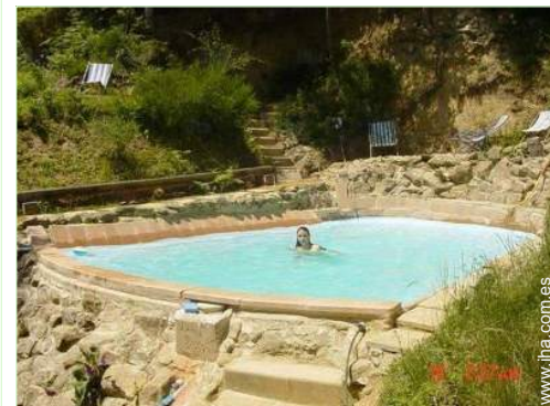
vista sobre la piscina