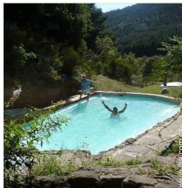
vista desde la piscina