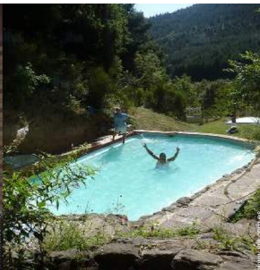
vista desde la piscina