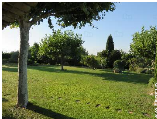
vista sobre el jardín/parque