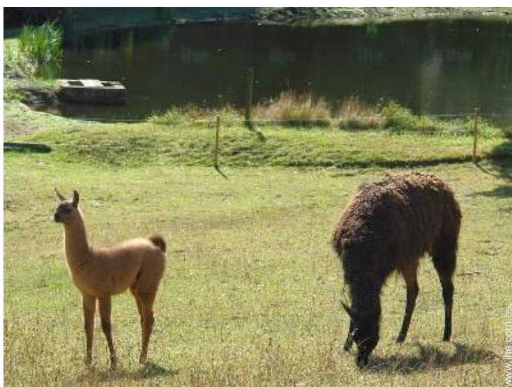
Los animales de la casa