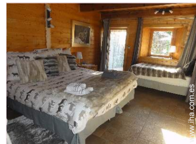
La habitación de huésped