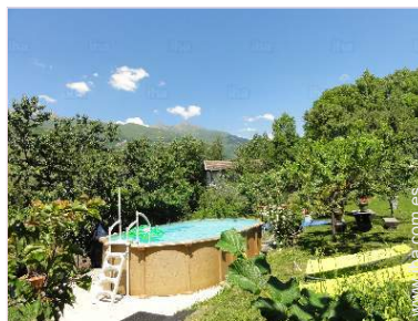
vista desde la piscina