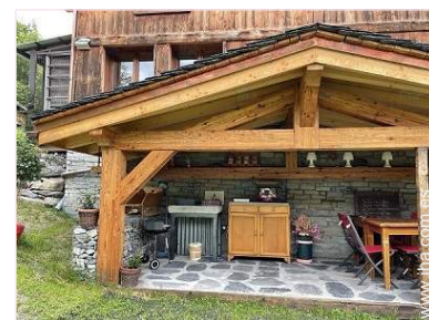
Instalaciones exteriores a disposición de los huéspedes