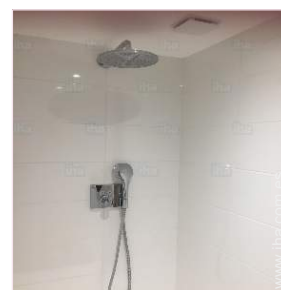
La habitación de huéspedes