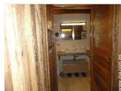
La habitación de huéspedes