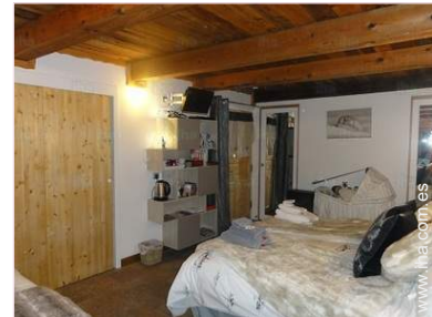
La habitación de huésped