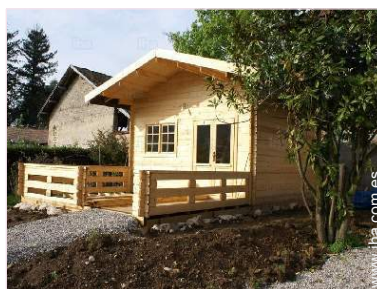
Chalet Bungalow con Encanto