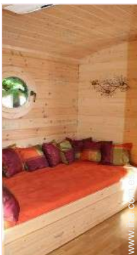
La habitación de huésped

Aparcamiento no cubierto : 2 plaza(s) reservada(s).