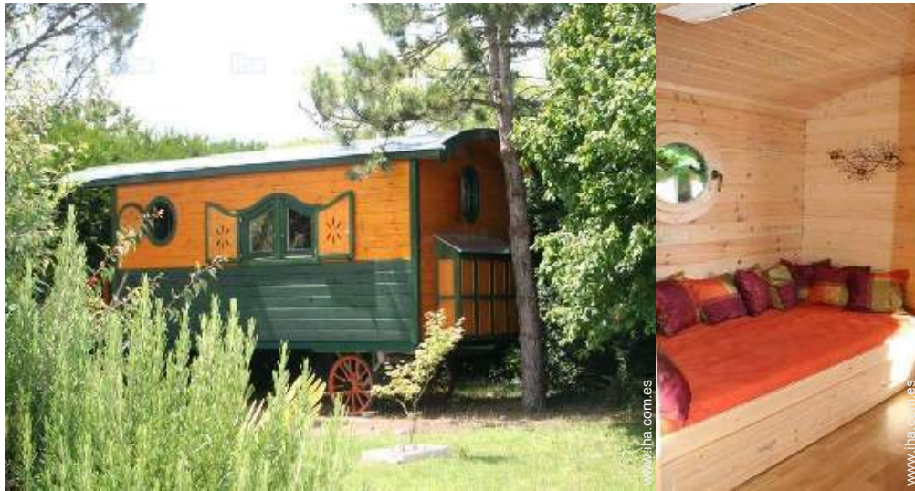
La habitación de huéspedes