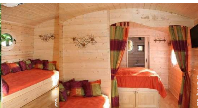
La habitación de huésped