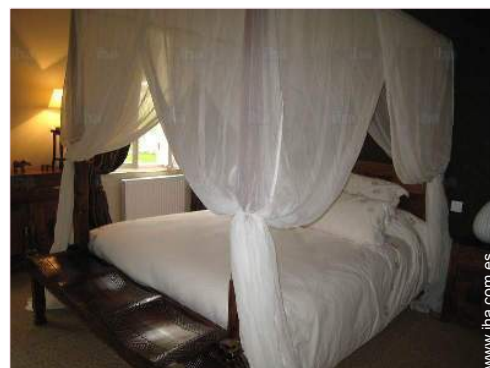
La habitación de huésped