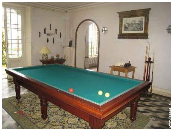
mesa de billar