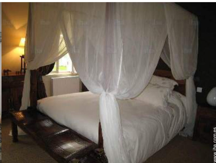
La habitación de huésped