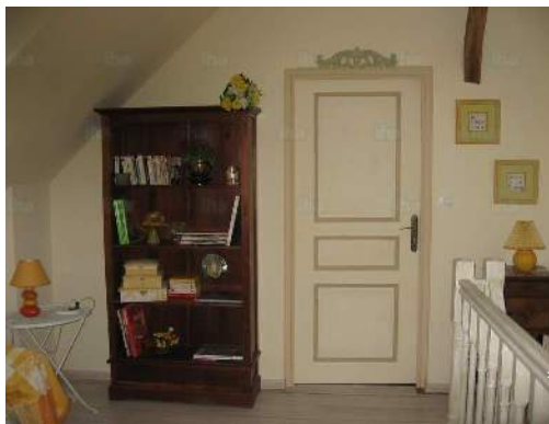
sala de biblioteca