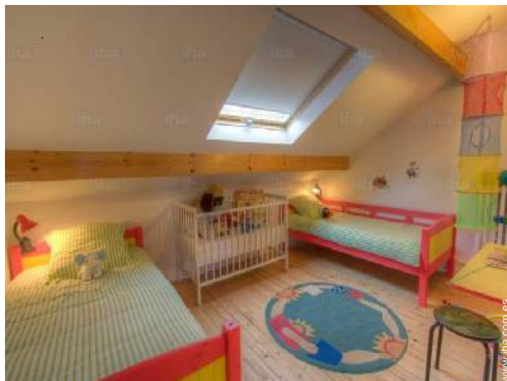
La habitación de huésped