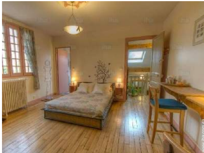
La habitación de huésped