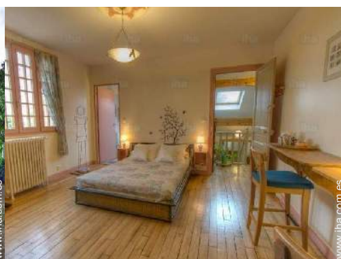
La habitación de huésped