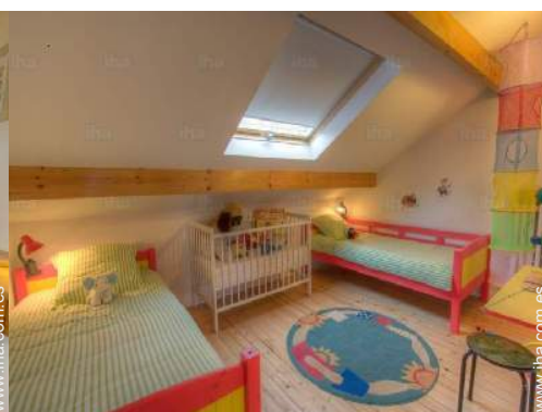
La habitación de huésped