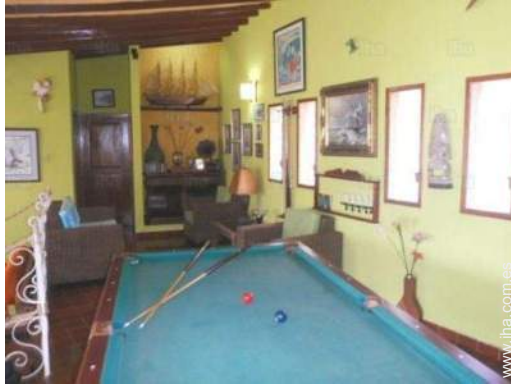
mesa de billar