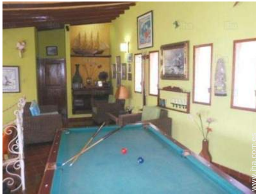
mesa de billar