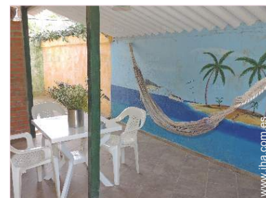
Instalaciones de ocio