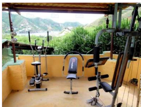
máquina(s) de musculación