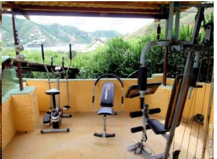
máquina(s) de musculación