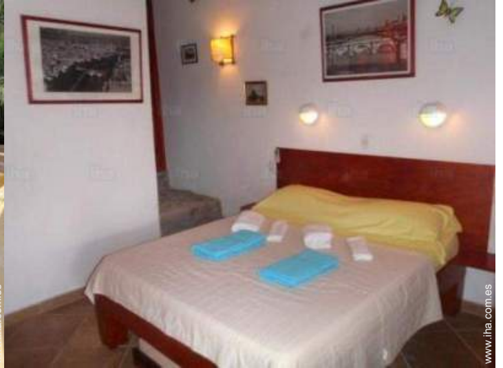
La habitación de huésped