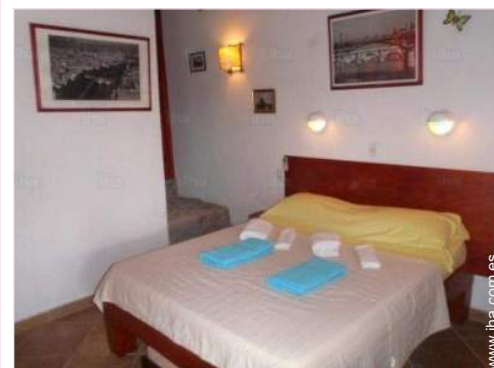
La habitación de huésped