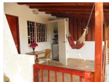
Instalaciones de ocio