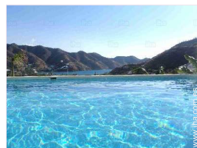
Instalaciones a disposición